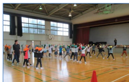
西豊田小学校 放課後子ども教室