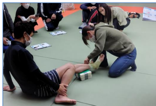
テーピング(応急処置)