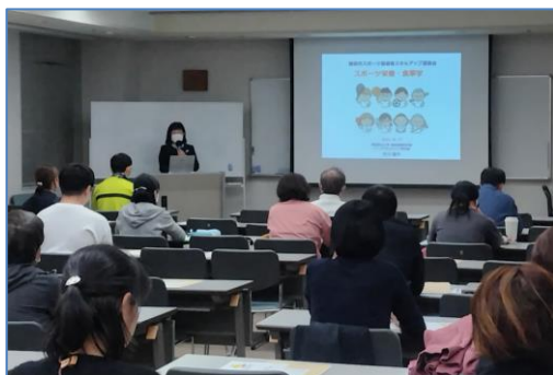
スポーツ栄養・食事学