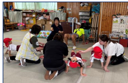
静岡聴覚特別支援学校 運動指導