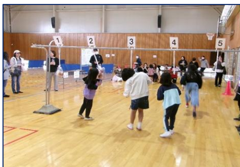
パン食い競争 蒲原体育館

令和5年度から連携を開始した明治安田生命保険相互会社には、事前の広報活動のほか、当日は「健康チェックブース」を担当していただいた。また、静岡銀行から地域貢献活動の一環として、行員の方々の協力をいただいた。このことにより予想を上回る来場者への対応も円滑に行うことができた。