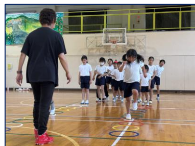
市立清水小河内小学校 放課後子ども教室 指導