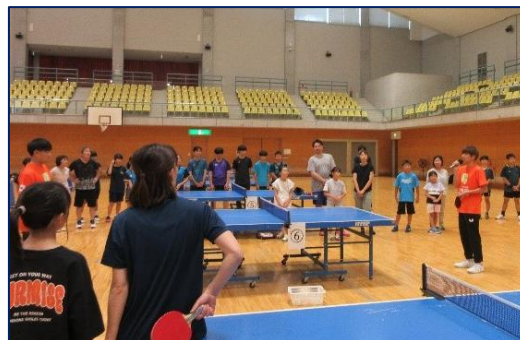
静岡ジェード 卓球教室 北部体育館