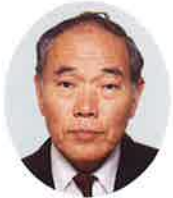
新 昇 静岡市剣道連盟