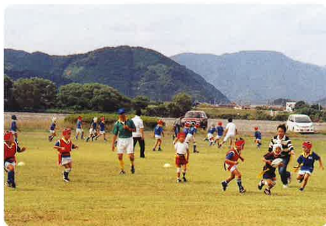
〈タグラグビー大会の様様〉

平成15年の静岡国民体育大会の後を受け、ラグビーのさらなる普及に効果的な事業・活動を、役員と共に各チーム部員等と努力を続けていきます。