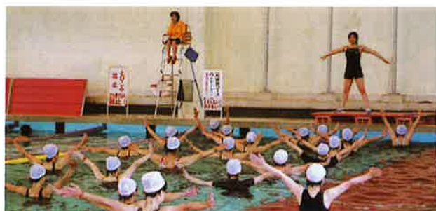
(アクアピクス教室他)