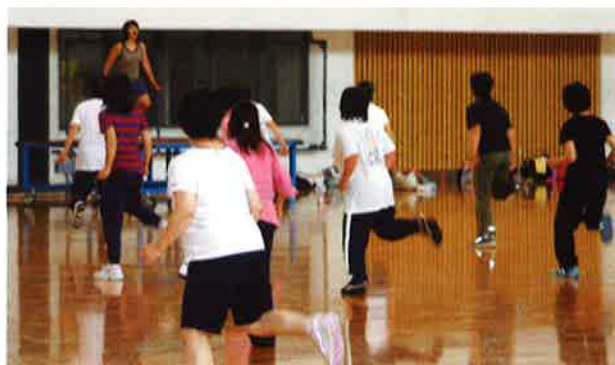
(フィットネス教室他)