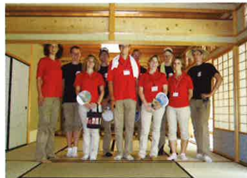
駿府公園紅葉山庭園内