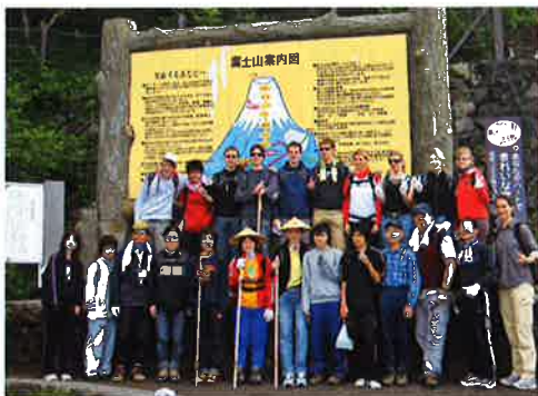
富士山新五合目(富士宮口)

この交流事業の所期の目的である両国スポーツ少年団の親睦を深めることができましたと思います。