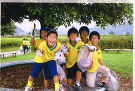
〈スポーツ少年団清掃奉仕活動〉