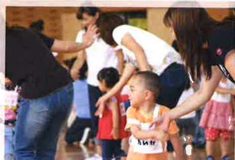
〈親子運動あそび教室〉