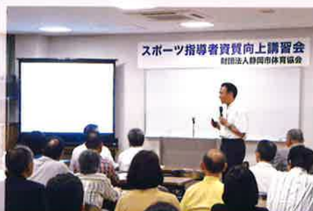
〈スポーツ指導者資質向上講習会〉