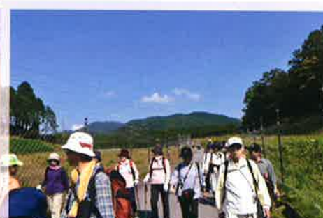
〈体協ウォーキング〉