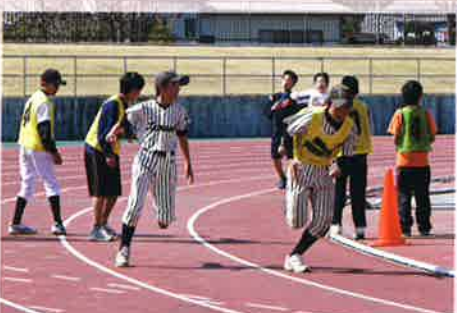
〈スポーツ少年団大会〉